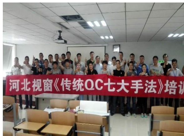
河北视窗玻璃有限公司 《传统 QC 七大手法》