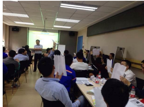
上海通用五菱汽车公司 《零缺陷质量管理》