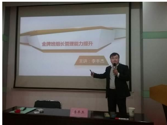
光电科技 《金牌班组长管理能力提升》