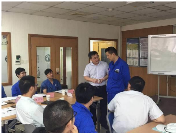
恩欧凯防振橡胶公司 《全员设备保安全管理——TPM》