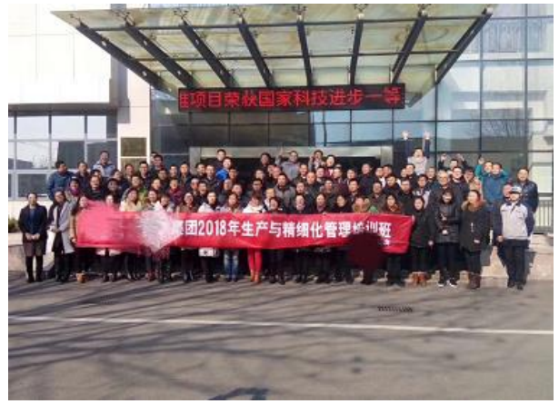
连云港鹰游纺机 《生产与精细化管理课程》