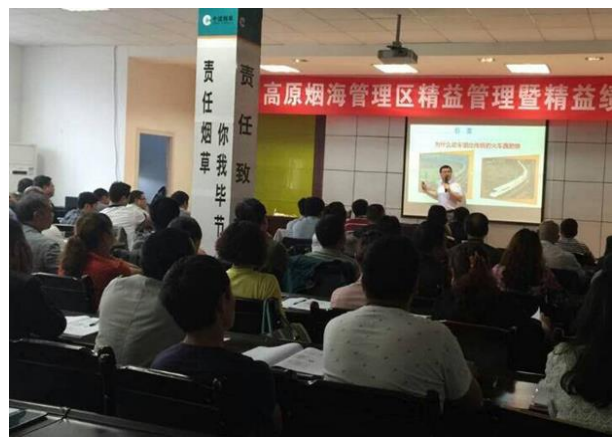
贵州高原烟海 《精益管理与绩效》