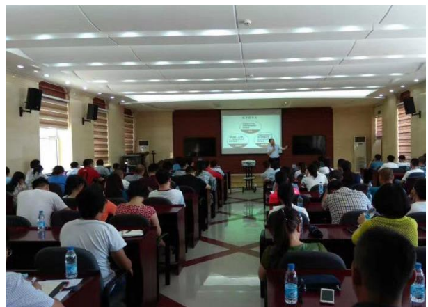
大庆油田第七采油厂 《精益生产运营管理》