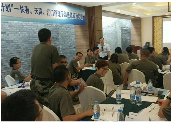
长春富奥集团 《卓有成效的管理者运营实务》