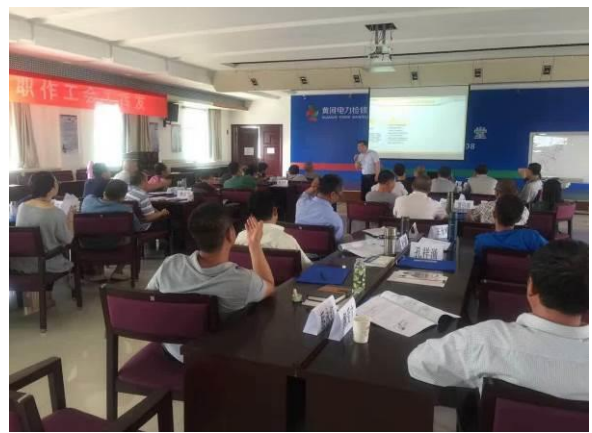
黄河水电检测公司 《金牌班组长管理能力提升》