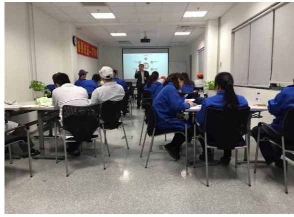
德国科世达 《6S 现场管理》