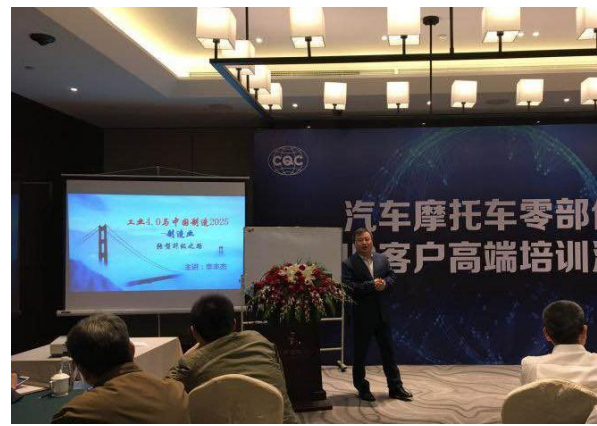
扬州汽车摩托车 VIP 高端客户 《工业 4.0 与中国制造 2025》