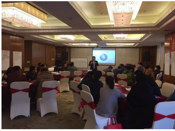
公开课 《全员质量管理——TQM》