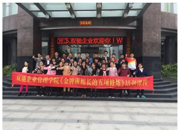
双驰企业 《金牌班组长的五项修炼》