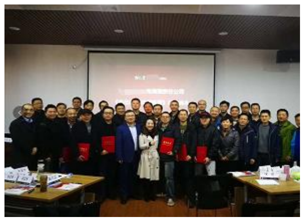
武汉华能发电集团 《杰出班组长实操训练》