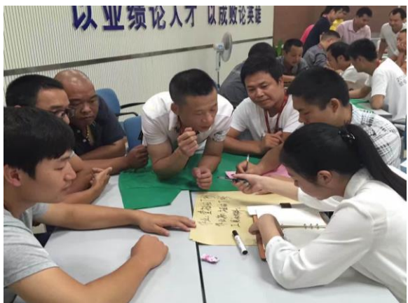
中国南车 《一线主管技能提升 —TWI 培训》第二期