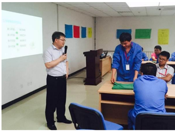
江苏大丰农场 《全面质量管理》