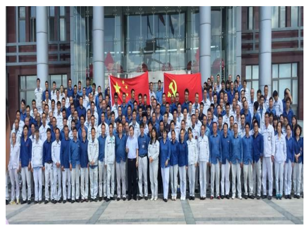
大唐内蒙古多伦煤化工有限责任公司 《金牌班组长管理能力提升》