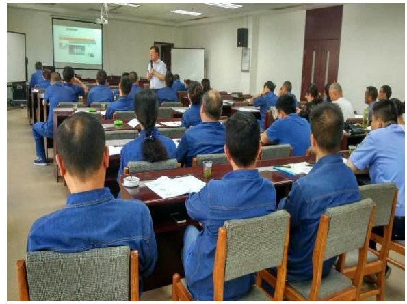
毕节卷烟厂 《精益生产管理》