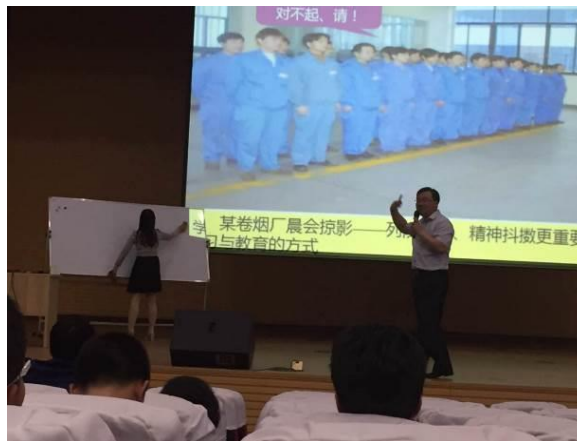
骆驼集团第二期 《精益生产管理》