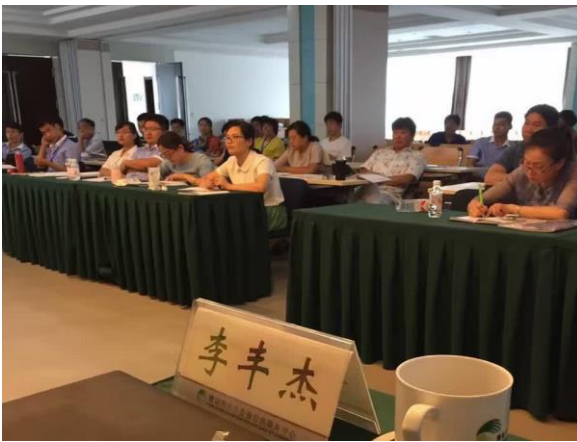
青岛制造业企业家 《智能制造与企业精细化生产运营》