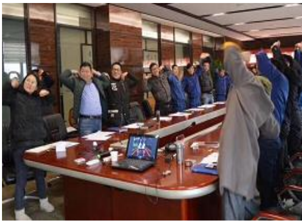
上海本优机械有限公司 《班组建设之新 5T 管理》