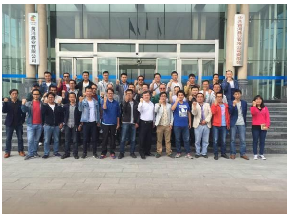
黄河鑫业有限公司 《智造百年——赢在质量》