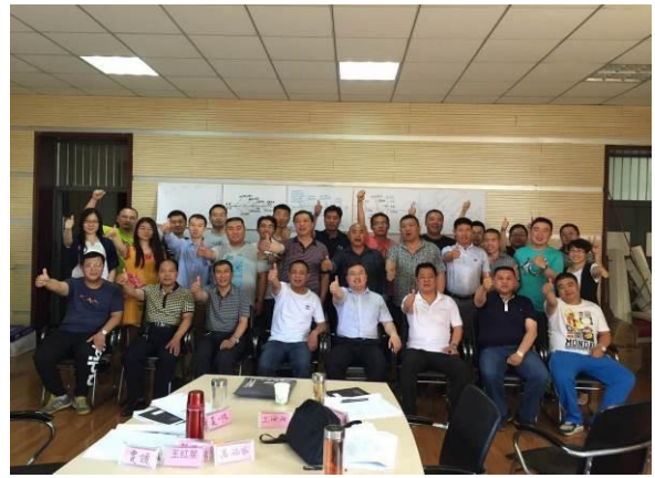
石家庄供电局 《金牌班组长管理能力提升》