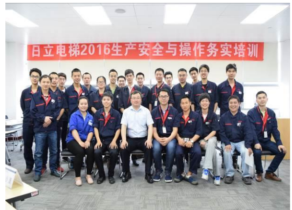
日立电梯 《重视安全管理——呵护生命》