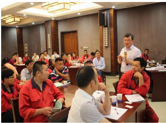
光明铁道控股有限公司 《企业优秀班组长技能提升》