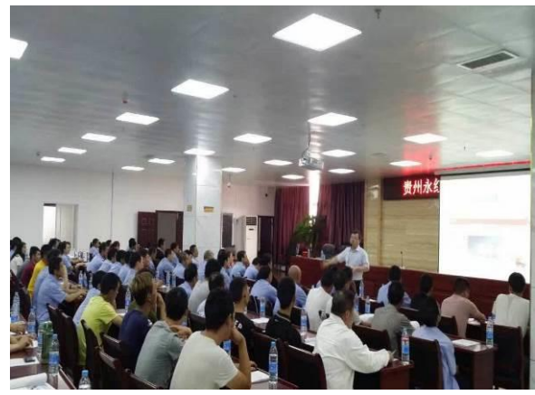
博鲁德公司 《金牌管理者职业化素养与能力提升》