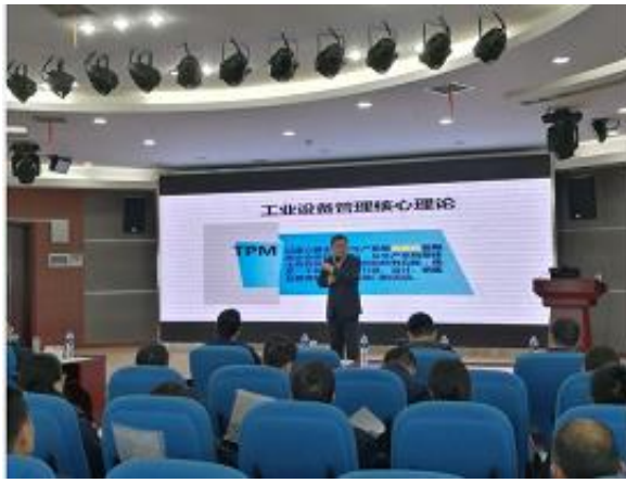
湖南华电长沙发电有限公司 《精益生产管理》