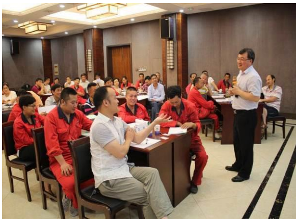
光明铁道控股有限公司 《全员质量管理》