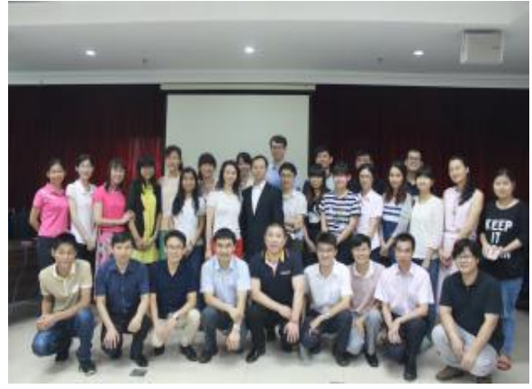
广东信源集团 《高效能沟通之妙笔生花：写作表达与呈现》