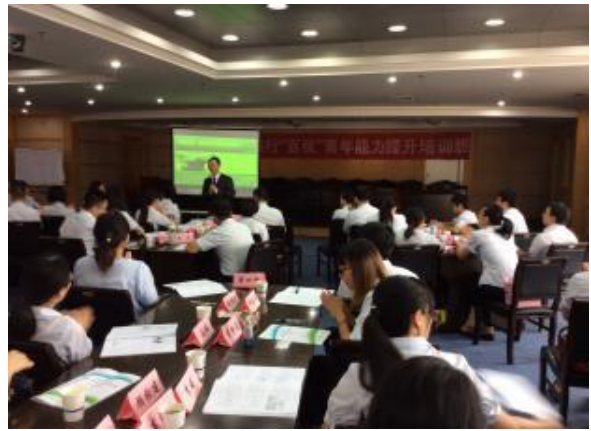
嘉兴禾城农商银行 《高效能职业人角色认知技巧》