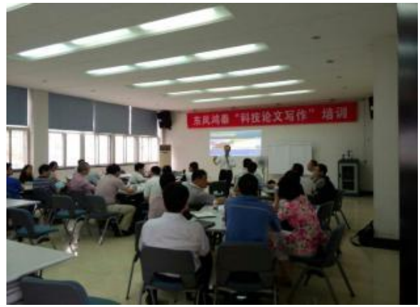
东风鸿泰集团 《妙笔生花：商务写作与呈现》