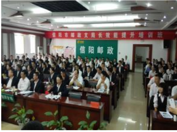
邮政储蓄银行河南信阳支行 《高效能执行七步法：让绩效倍增的执行力训练》