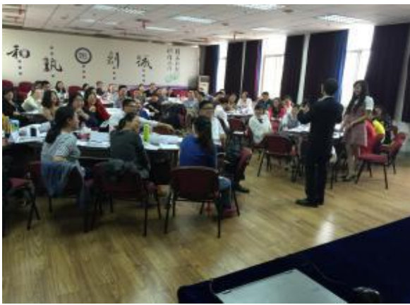
光大银行武汉分行 《金字塔思维与写作表达》