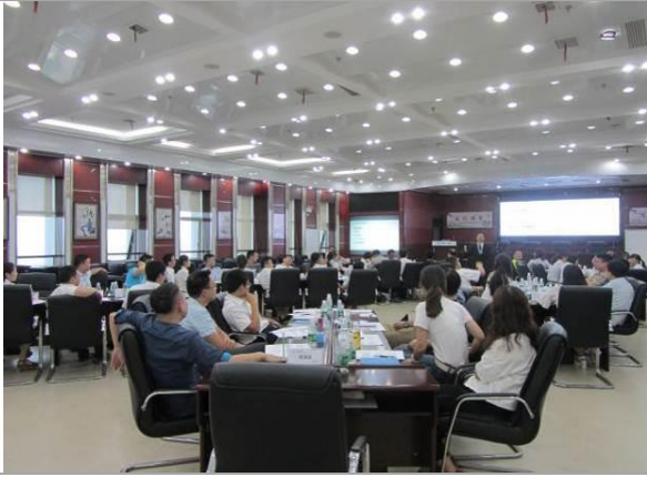
长沙移动 《职业素养六度修炼》