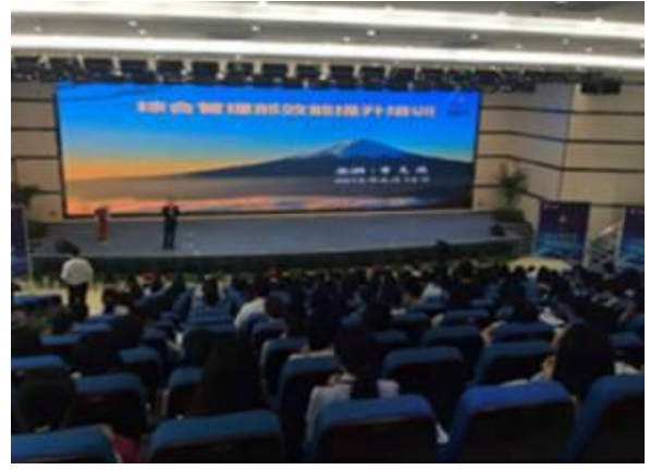
安徽钰诚集团 《高效能执行七步法：让绩效倍增的执行力训练》