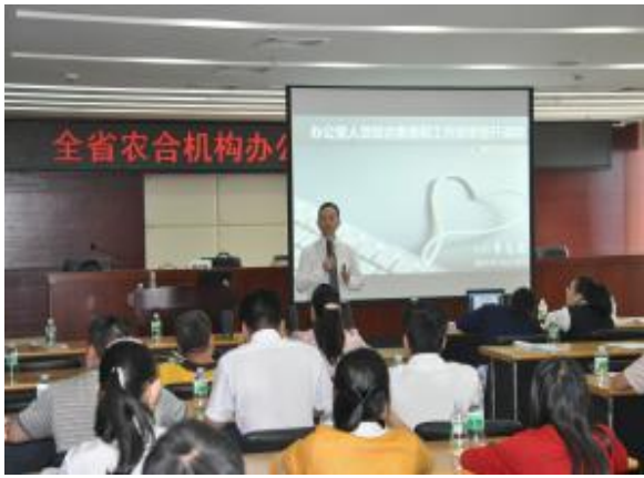
广东省农村信用联社 《高效能办公室综合员工训练营》