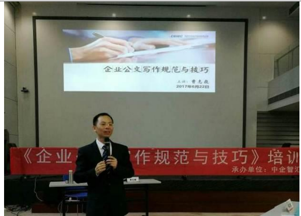
深圳中电 《公文写作》