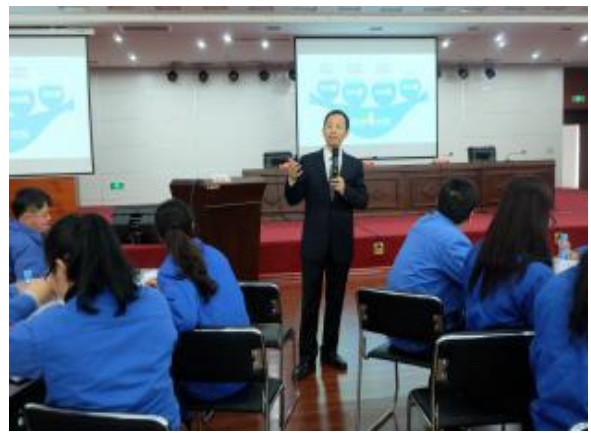
江西中烟赣州卷烟厂 《金字塔思维与写作表达》