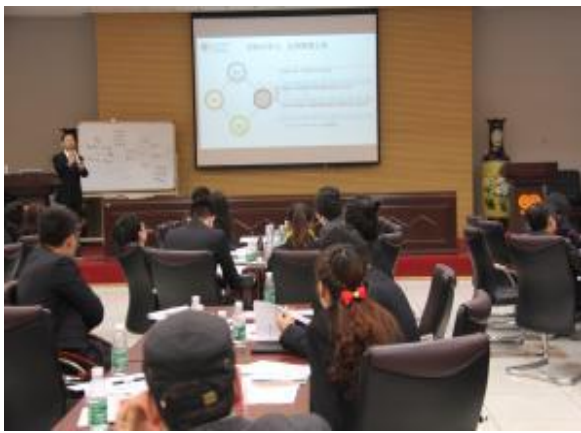
株洲高科集团 《高效能提升组织管理的六维能力》