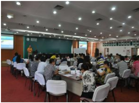
国家电网重庆分公司 《妙笔生花：商务写作与呈现》