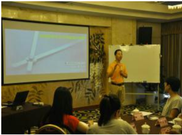
大唐国际股份 《高效能时间管理》