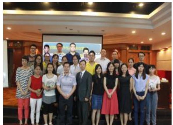
广东信源集团 《高效能会议管理》