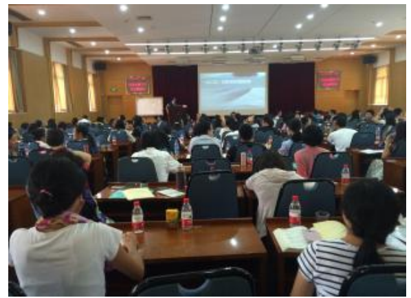
广州市政府系统培训