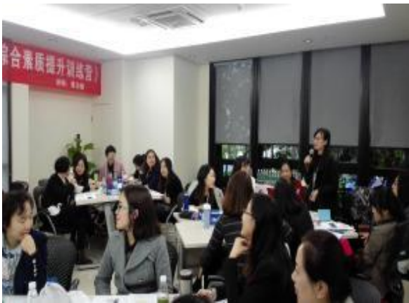
深圳迈瑞股份 《高效能职业人角色认知技巧》