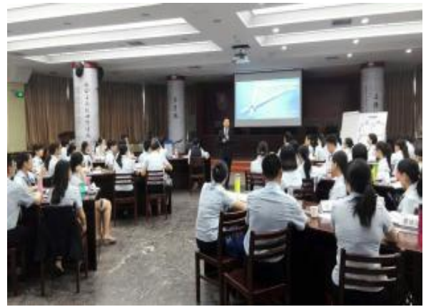
中国建设银行柳州分行 《高效能时间管理》