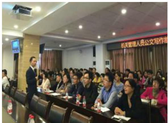
葛洲坝集团 《最新党政机关公文写作技巧训练》