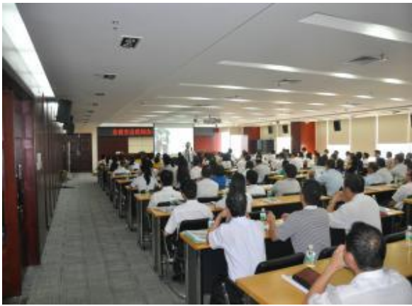
广东省农村信用联社 《高效能自我绩效管理》