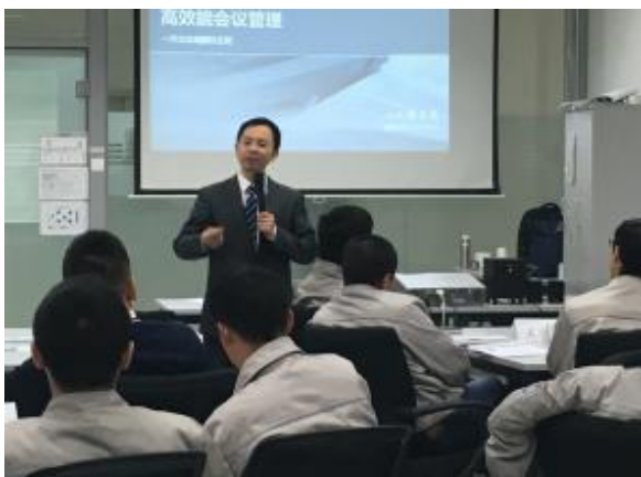
一汽大众 《高效能会议管理》