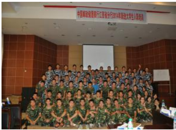
邮政储蓄银行江西省分行