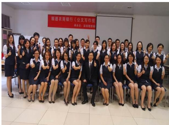
深圳建设银行 《妙笔生花：公文写作技能提升训练》