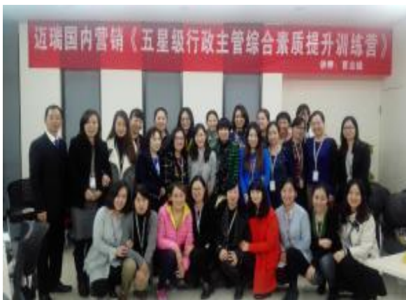
深圳迈瑞股份 《高效能执行七步法：让绩效倍增的执行力训练》