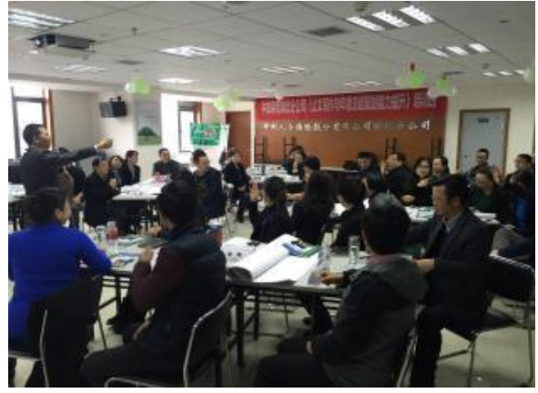
中邮保险湖北分公司 《高效能目标管理与计划落实》