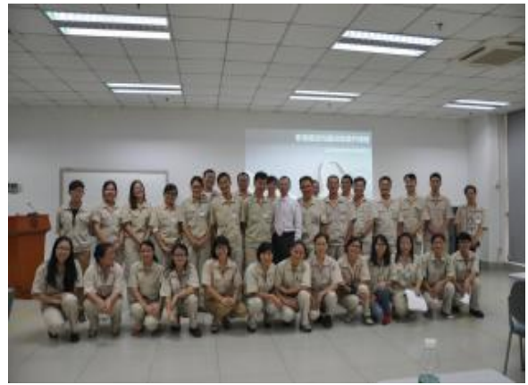
东芝集团 《高效能沟通之能说会道：360度高效沟通》