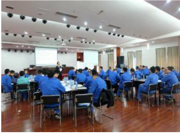
江西中烟赣州卷烟厂 《高效能目标管理与计划落实》