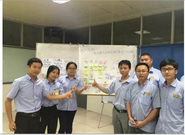
莆田某汽车轮胎公司 《高效汇报与跨部门沟通技巧》