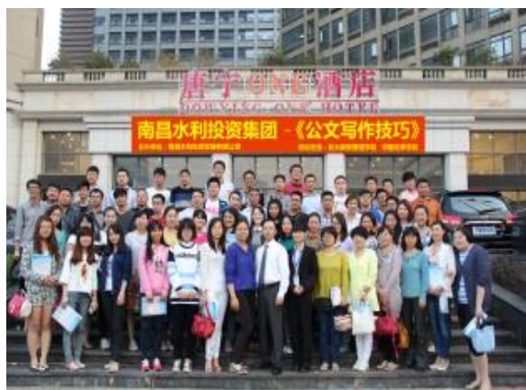
南昌水利集团 《妙笔生花：商务写作与呈现》