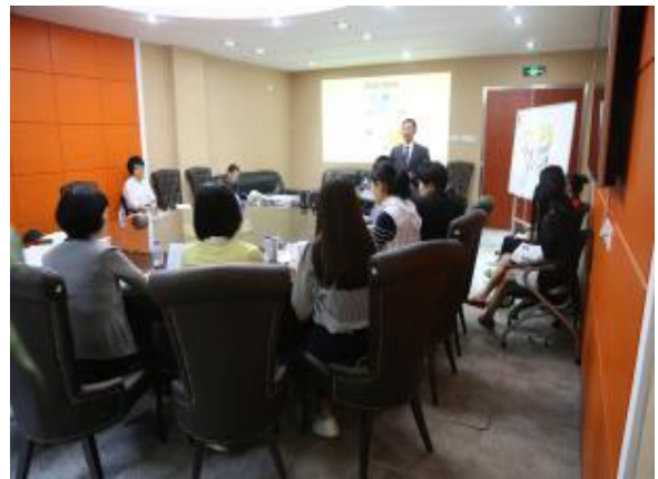
深圳能源集团 《高效能素养六度修炼》