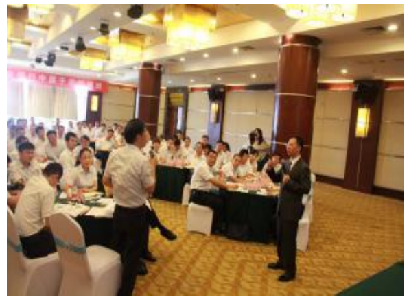
南京泰兴农商行 《高效能提升组织管理的六维能力》