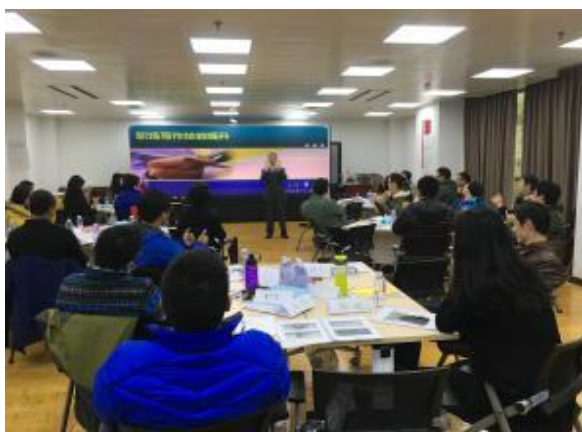
中国神华集团 《妙笔生花：商务写作与呈现》