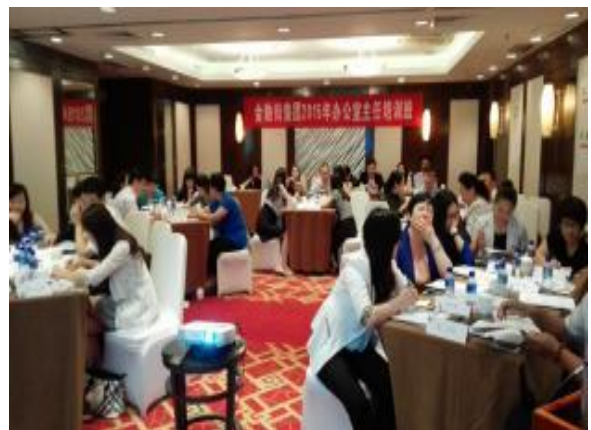
北京金融街集团 《高效能执行七步法：让绩效倍增的执行力训练》