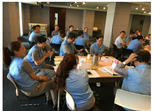
天津烟草 《高效能会议管理》