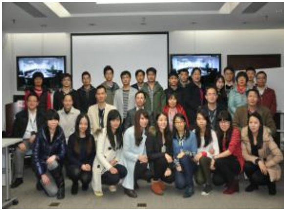
邮政储蓄银行广东省分行 《高效能沟通之妙笔生花：写作表达与呈现》