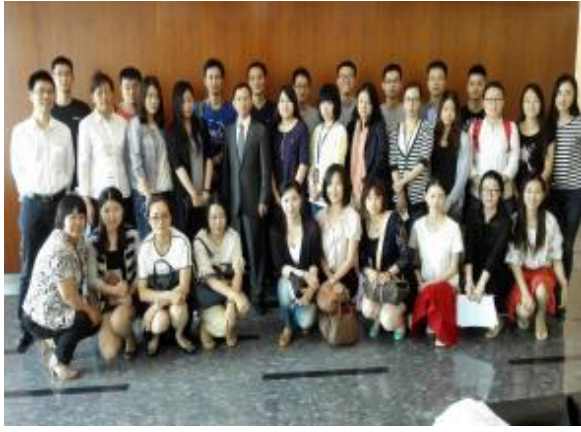
北京银行上海分行 《高效能沟通之妙笔生花：写作表达与呈现》