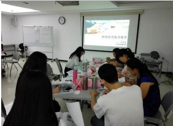
汕头电信 《职场写作能力提升》