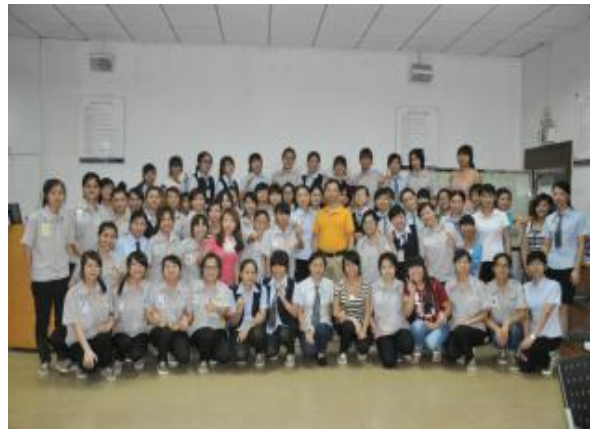
深圳竞华电子 《高效能办公室综合员工训练营》