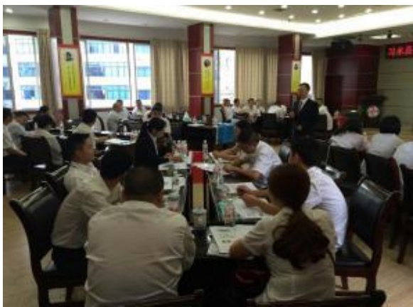
贵州遵义烟草专卖局 《最新党政机关公文写作技巧训练》